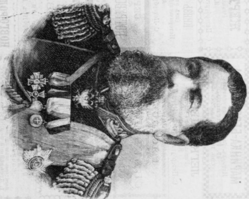
Командующій войсками казачьаго воинскаго округа, генераль-адъютантъ Г. В. Мешеринновъ. «Родина», 1895 г., № 41.